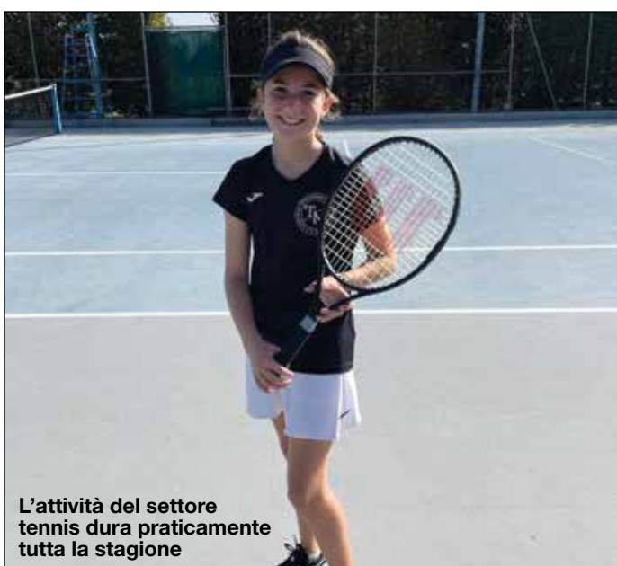
L'attività del settore tennis dura praticamente tutta la stagione